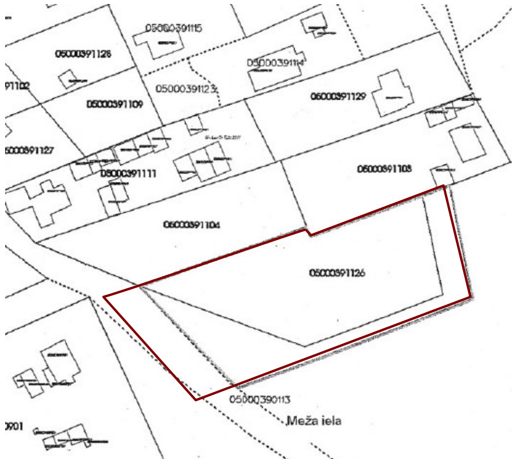
Attēls Nr. 2. Detālplānojuma teritorijas kadastra vienību shēma.