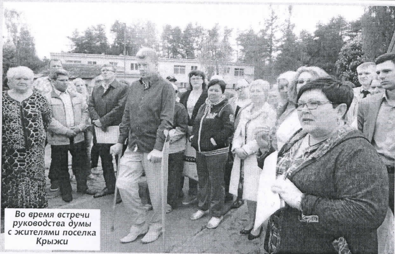
Во время встречи руководства думы с жителями поселка Крыжи

Люди с особыми потребностями, инвалиды, дети-сироты вынуждены жить вне общества – в приютах, пансионатах, детдомах. Наше отношение к этим людям неоднозначно. Если это лица с душевными расстройствами, то порой мы относимся к ним с непониманием или страхом, иногда даже отвращением.