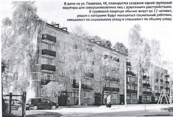
В доме на ул. Полигона, 48, планируется создание одной групповой квартиры для совершеннолетних лиц с душевными расстройствами. В групповой квартире обычно живут до 12 человек, рядом с которыми будут находиться социальный работник, специалист по социальному уходу и специалист по общему уходу.

В мире о деинституционализации начали говорить в 80-е годы XX века, когда активисты защиты прав человека обратили внимание на лиц с душевными расстройствами и объявили, что у них есть все права жить в семейной среде, а не в изолированных закрытых учреждениях.