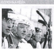
Депутаты Думы поддержали выделение 80 тыс. евро на создание нового кружка при Детско-юношеском центре «Юниор». Это будет школа для молодых спортсменов, о создании которой мы много говорили в предвыборную кампанию.

SIA "DauTKom Plus" piedāvā Daugavpils pilsētas domei izvietot: publikāciju laikraksta "Seičas" 29.03.2018. numurā. Publikācija tiks izvietota laikraksta "SeiČas" 6.lappusē (melnbalta); publikācijas laukuma izmērs 237.25 cm 2 (6.5 cm x 36.5 cm); kopējās izmaksas EUR 118.63 un PVN 21% EUR 24.91, kopā ar PVN 21% izmaksas sastāda EUR 143.54 (viens simts četrdesmit trīs eiro 54 centi).