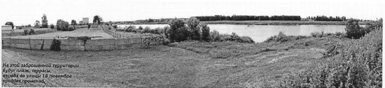
На этой заброшенной территории будут пляж, террасы, отсюда до улицы 18 Новембра пройдет променада.

Rakstu "Каким будет променадад над Даугавой" laikraksta "Seičas" 21.04.2016. numurā. Raksts tiks izvietots laikraksta "Seičas" 7.lappusē (melnbaltā); raksta laukuma izmērs 484.50 cm 2 (25.5 cm x 19 cm) (izmaksas par 1cm 2 sastāda 0.70 Eur + PVN 21%); kopējās izmaksas EUR 339.15 un PVN 21% EUR 71.22, kopā ar PVN 21% izmaksas sastāda EUR 410.37 (četri simti desmit euro trīsdesmit septiņi centi).