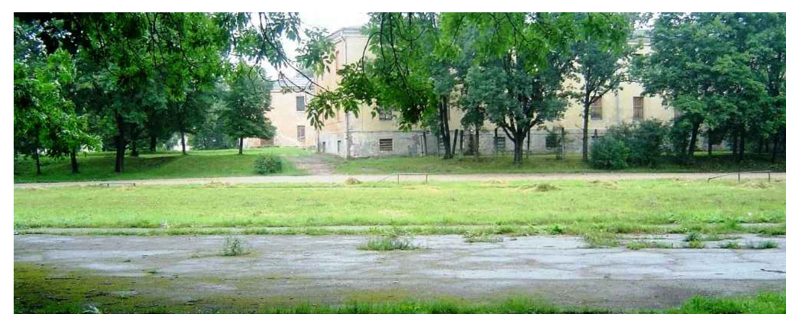
ESOŠAIS SKATS Nr.4