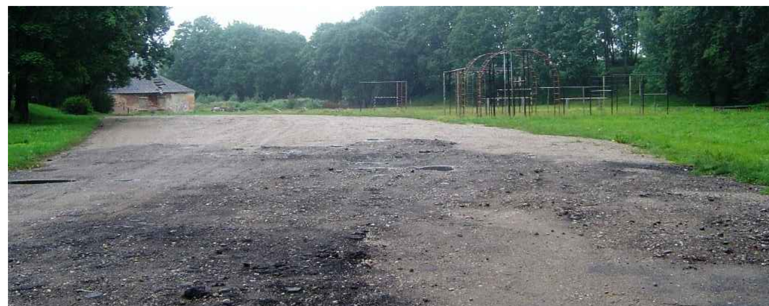
ESOŠAIS SKATS Nr.1