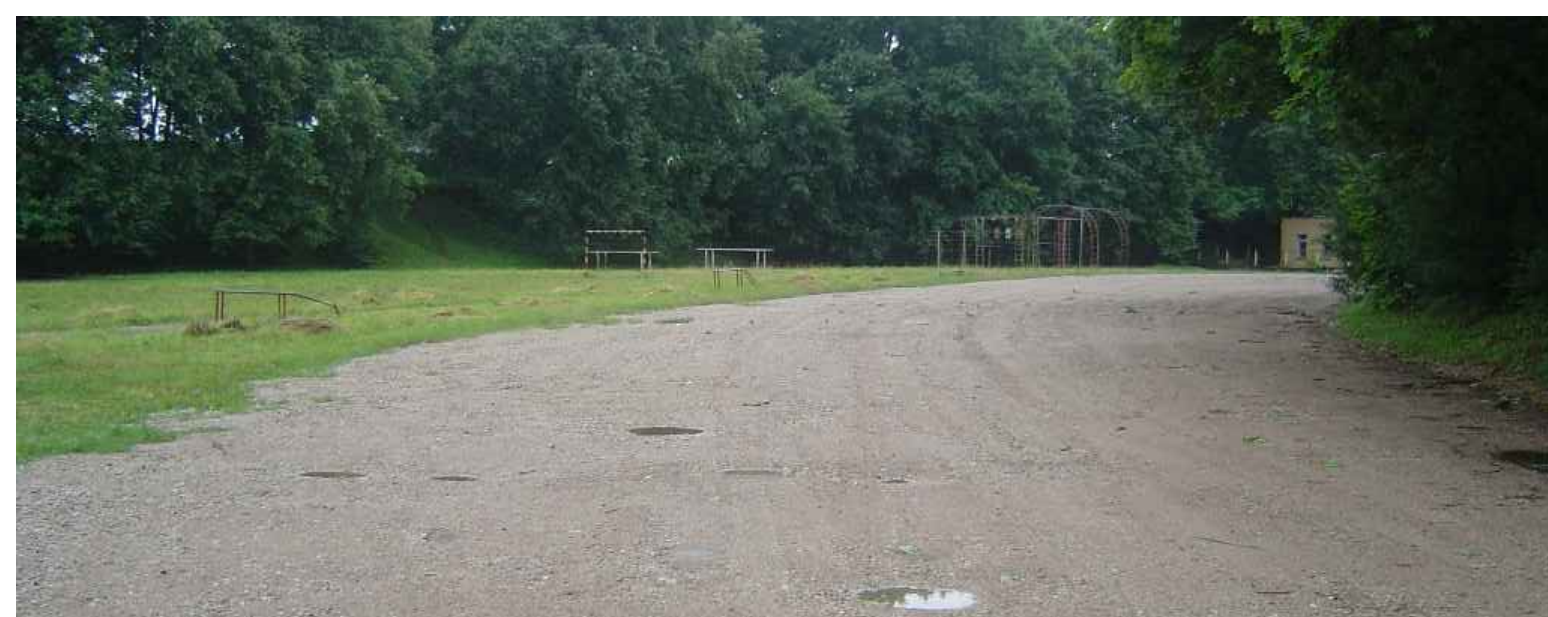
ESOŠAIS SKATS Nr.2