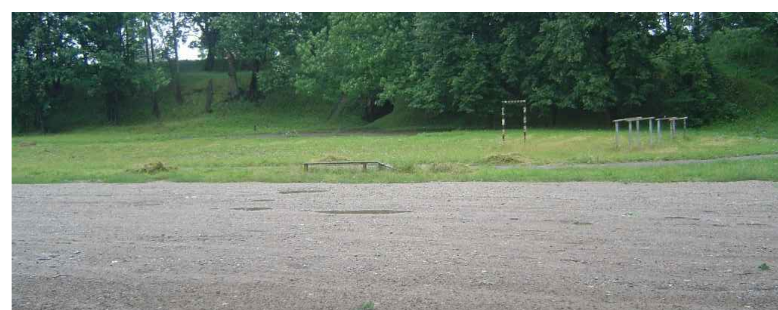
ESOŠAIS SKATS Nr.3