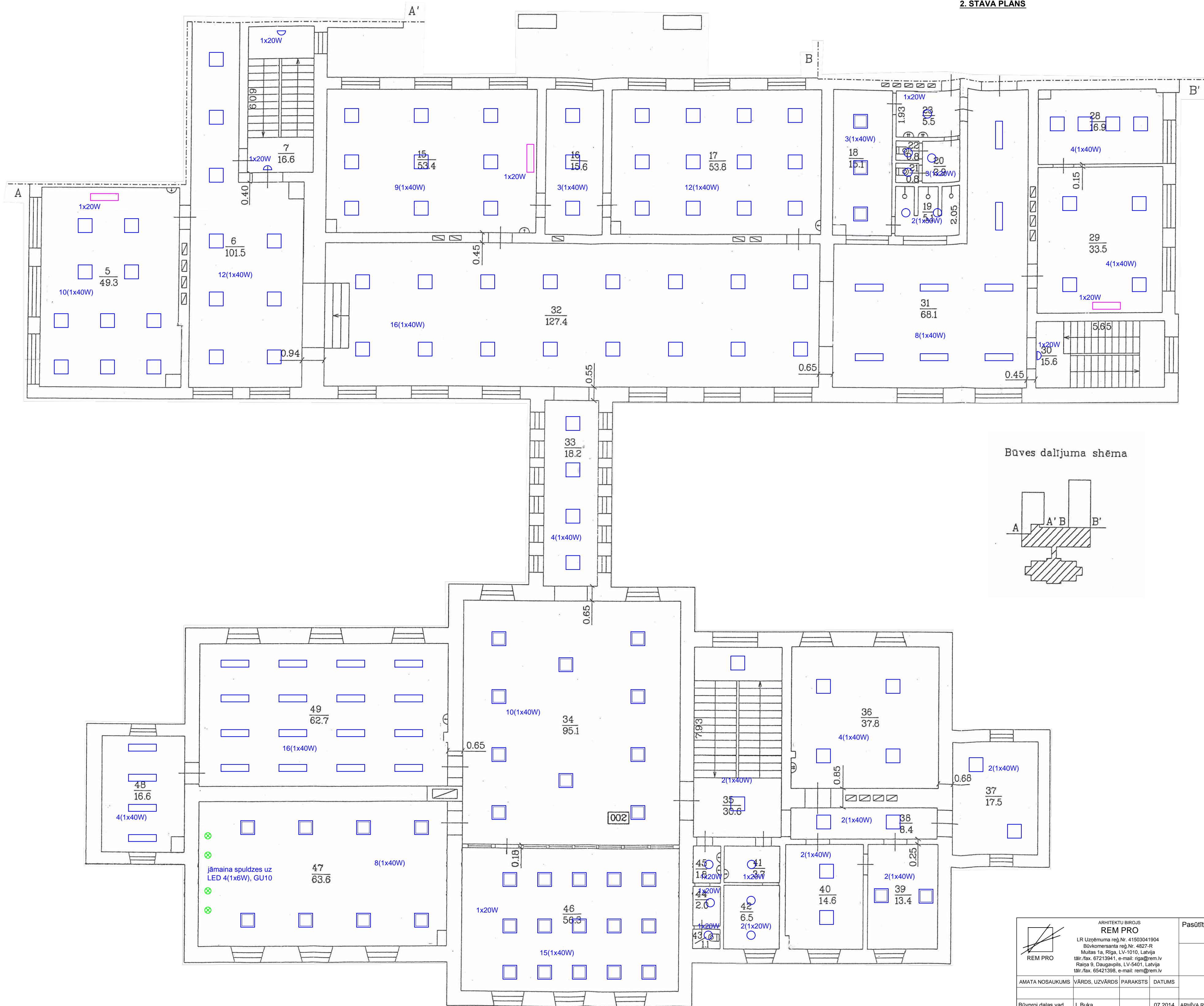
Būves dalījuma shēma