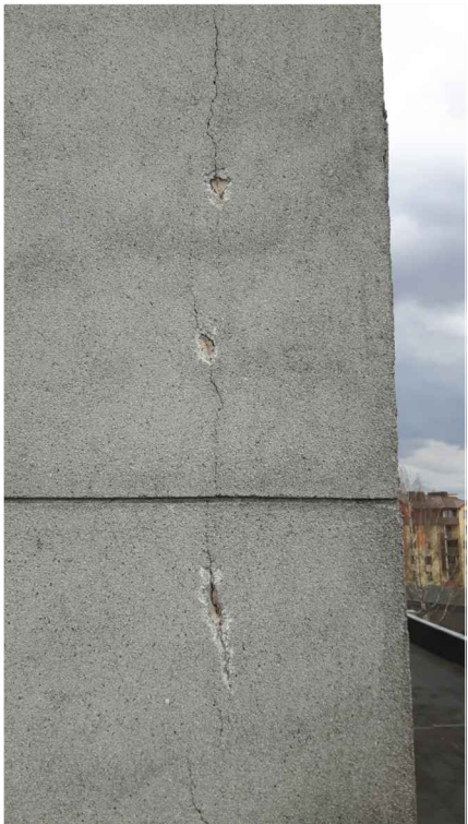
PLAISAS NOSTIPRINĀŠANA ĶIEĢEĻU SIENĀ M 1:20